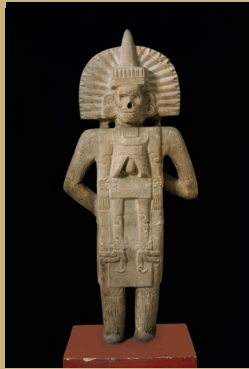
Huastec artist. Life-Death Figure (front and back), 900–1250. Possibly found at Chilitujú, San Luis Potosí, Mexico. Sandstone, traces of pigment, 62 3 / 8 x 26 x 11 1 / 2 in. (158.4 x 66 x 29.2 cm). Brooklyn Museum, Henry L. Batterman Fund and the Frank Sherman Benson Fund, 37.2897PA