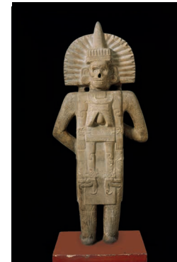
Artista Huasteca Figura de Vida y Muerte , (frente y parte posterior), aprox. 900–1250. Encontrada posiblemente en el sitio de Chilitujú, San Luis Potosí, México. Arenisca, trazas de pigmento, 62 3 / 8 x 26 x 11 1 / 2 in. (158.4 x 66 x 29.2 cm). Brooklyn Museum, Fondo Henry L. Batterman y Fondo Frank Sherman Benson, 37.2897PA