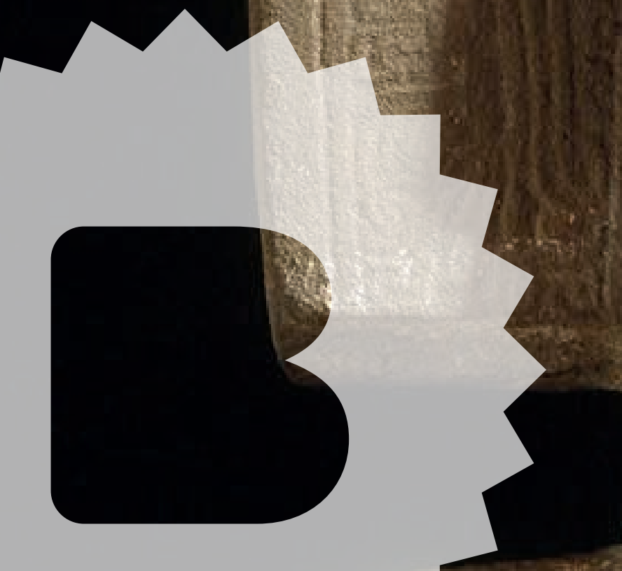
Figura de Vida y Muerte , 900–1250